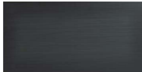
REFLEX N 30x60 - 12"x24"