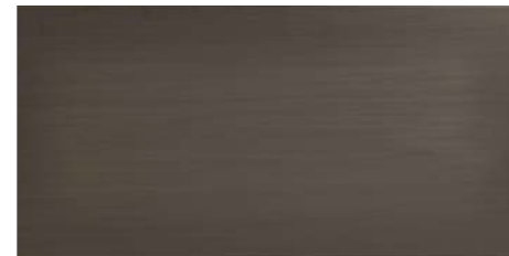
REFLEX T 30x60 - 12"x24"