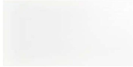
REFLEX W 30x60 - 12"x24"