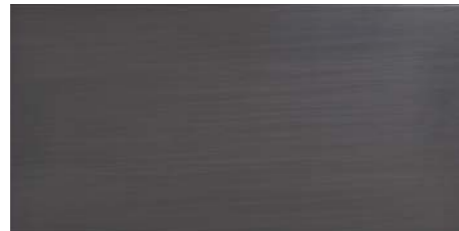
REFLEX DG 30x60 - 12"x24"