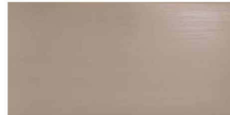
REFLEX TO 30x60 - 12"x24"